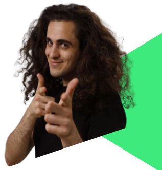
Kotoon TikToker & Creator